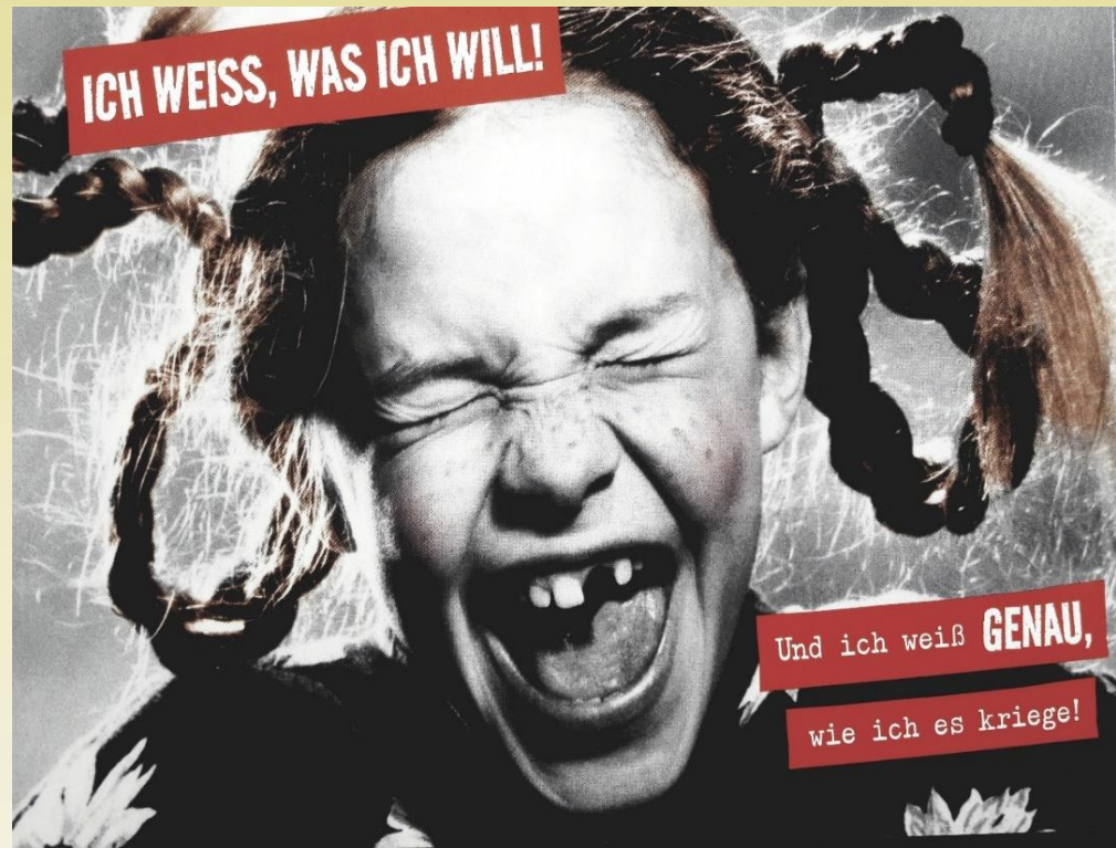
Text Werner Bethmann „Das Original“